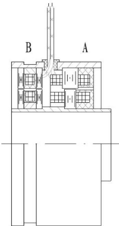
图 1、环形变压器式旋变结构示意图